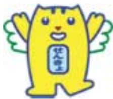
イメージキャラクター 選挙のめいすいくん