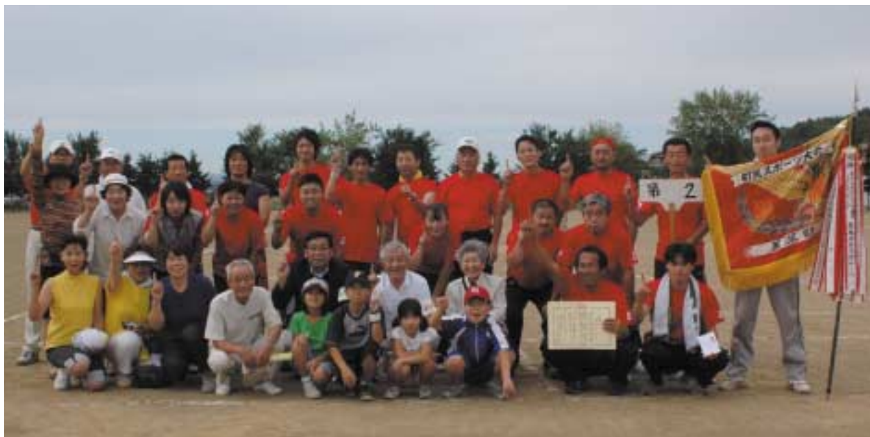
▲第52回の町民大運動会を制した第2町内会