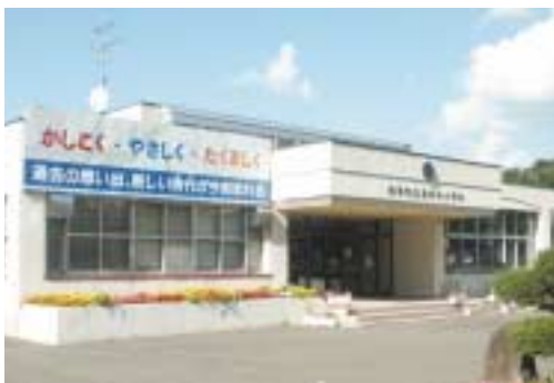
▲来年3月に統廃合する恩根内小学校

同校は、3年後の平成22年には、児童数が3名になるなど児童数の減少を背景に、地域の自治会や学校、PTAなどが昨年から話し合いの場をもち、今年3月