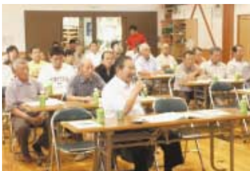
▲設立総会で意見交換を行う参加者

また町では、9月19日に開かれた町議会定例会において、同校の閉校に関する関連条例の改正や補正予算を町議会に提案し、原案どおり可決されました。