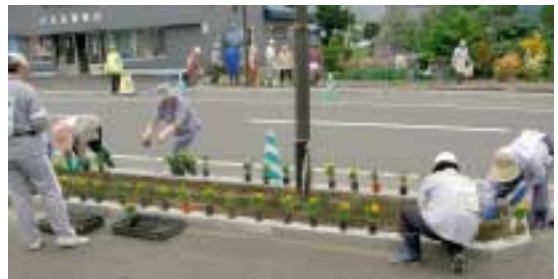
▲第1町内会ボランティアサポート花植え風景

来年もこの事業は継続して行きますので、花を植えたいと思われる方は、ボランティア団体などを組織して開発局までご連絡ください。また、現在空いている花壇に花を植えたいと思われる方はいませんか？今年もVSPによる支援は受けられませんが、個人・団体ともに現在受付しています。