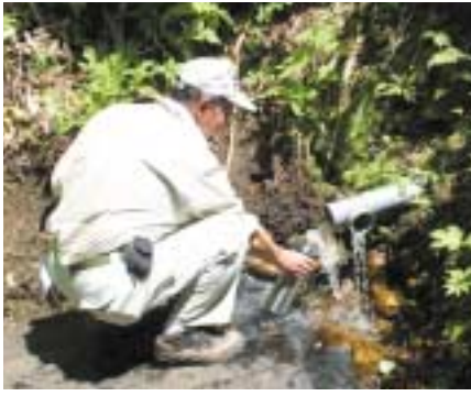
▶平成の名水百選(6月25日認定)に選ばれた仁宇布の冷水

町内仁宇布地区にある「仁宇布の冷水と十六滝」が環境省が認定する「平成名水百選」に選ばれました。平成の名水百選は、今年7月に環境問題が主要議題の一つとして開催される北海道洞爺湖サミットにちなみ、水環境保全の一層の推進を目的に、昭和60年に選定した「名水百選」に加え新設されたものです。