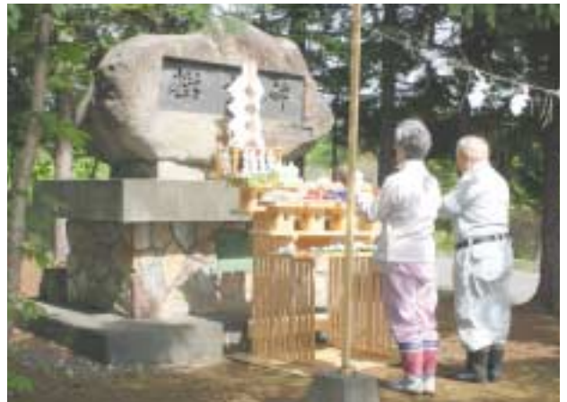
町緑化推進委員会主催の樹霊祭が菊丘公園樹霊碑前で行われ、林業関係者ら42人が参列し、一年の無事故無災害を祈願しました。引き続き、植樹祭が仁宇布地区の町有林で行われ、アカエゾマツの苗木300本が植樹されました。（5月29日）