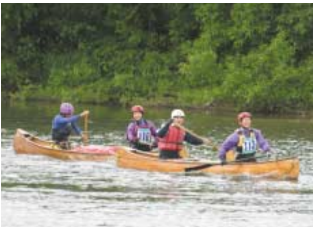
美深A P T主催の天塩川オープンカナディアンカヌーレースが開催されました。大会には道内各地から20チーム40人が参加。雄大な天塩川の流れを楽しみながら、16 時 先のゴールめざしてレースを繰り広げていました。（6月14日）