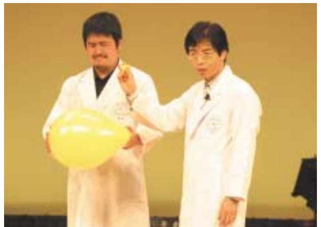
COM100自主事業「でんじろう先生のサイエンスショー」が文化会館で行われました。紙や風船、ダンボールなど身近なものを使った楽しい不思議な科学実験の数々に、満員の会場からは大きな感嘆の声があがっていました。（6月1日）