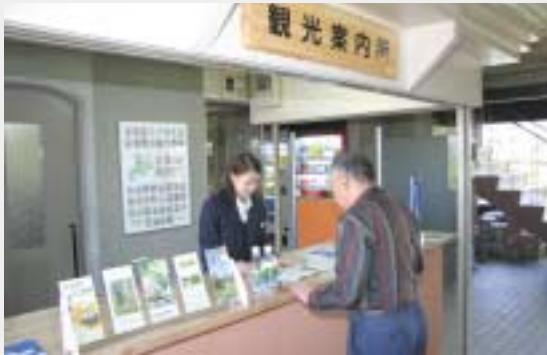
▶観光案内所が併設された新しい観光協会事務所