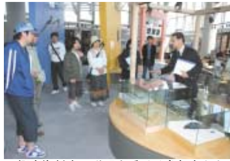
▲郷土資料室の説明を受ける参加者たち

この春、転勤などで美深町に新しく転入された町民の方を対象とした町内施設見学会が、5月17日に開催されました。