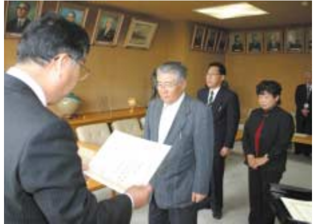
美深町長と自衛隊旭川地方協力本部長連盟による自衛官募集相談員の委嘱状交付式が町役場で行われました。相談員の任期は2年。今後、地域と自衛隊とのパイプ役となり自衛官募集の広報活動や入隊予定者の支援を行います。（5月22日）