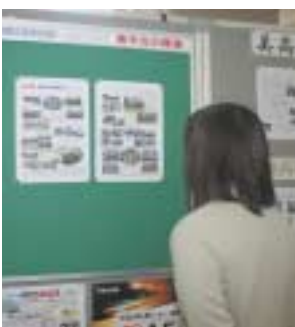
▲COM100にある情報掲示板