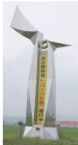
▶国道40号沿い美深3線と4線間にある「美深100年記念塔」

れ幕にして季節ごとに皆さんにお伝えします。また、団体などのイベント情報掲示にもお貸ししますので、観光協会にご相談ください。