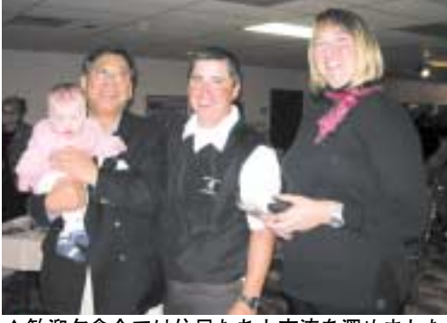
▲歓迎夕食会では住民たちと交流を深めました

親善訪問では、学校や歴史館、民間の牧場や農場などを視察見学したほか、同村主催の歓迎夕食会に出席しました。歓迎夕食会では、アンダー