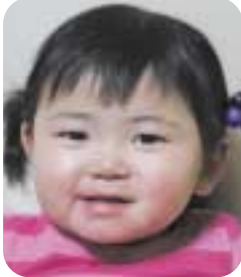
○笑顔が素敵な子に育ってね …(父・母)