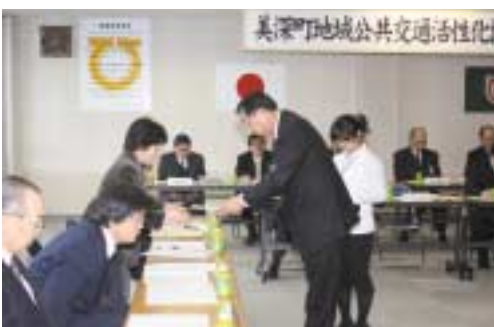
▲委員一人一人に委嘱状が交付されました

この日は、委嘱状交付のほか、現在の美深町の公共交通の課題などについて協議が行われました。今後協議会では、平成22年3月までに地域公共交通