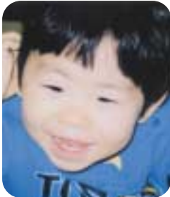
○心優しい子に育ってね …(父・母)