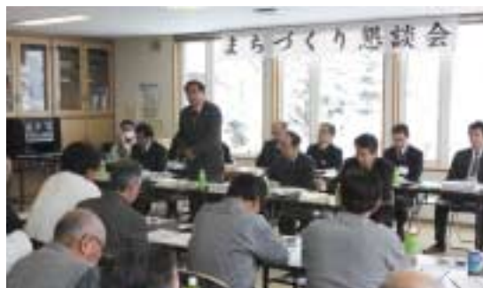
▲西紋自治会で開催されたまちづくり懇談会

については、十分検討を重 ね、総合計画や行政改革に 反映するよう、現在作業を 進めています。