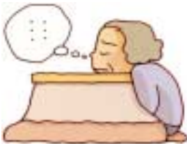
人と話す機会がない

次のことにはあてはまる方は「口の寝たきり」予備群です このままでは、からだは動いても「口の寝たきり」に！