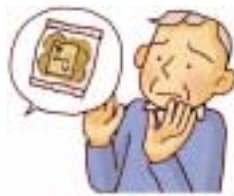
堅いものを 食べない