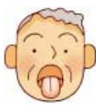
しこう ぜったい 歯垢や舌苔が たくさんついている