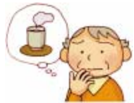
口の渇きが気になる