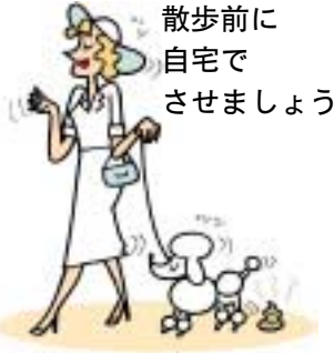
散歩前に 自宅で させましょ

ペットのふん尿は「固さ」「臭い」「色」などで、健康状態を確認することができ、病気の早期発見にもつながります。散歩の前にふんや尿をさせる習慣を教え、他人の土地・建物のもとより道路などの公共敷地などを汚さないようにしましょう。