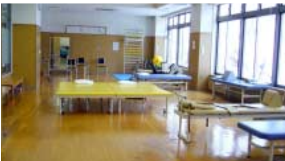
美深厚生病院「機能訓練室」

今後とも理学療法科をよろしく願います。 (駐在中は温泉、スーパー、コンビニ、食堂、体育館など色々とお世話になっております。)