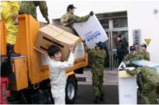
美深町は東日本大震災支援のため、陸上自衛隊名寄駐屯地を訪れ、毛布、アルミマット、給水袋を救援物資として提供しました。(3月22日)