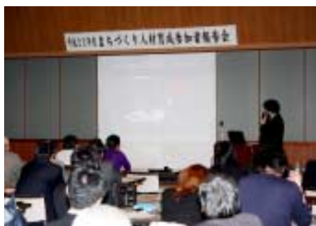
まちづくり報告会の様子

は、「行政・住民・団体が共に地域を創る」をテーマに話され、同じ目標に向かう地域づくりについて報告されていました。