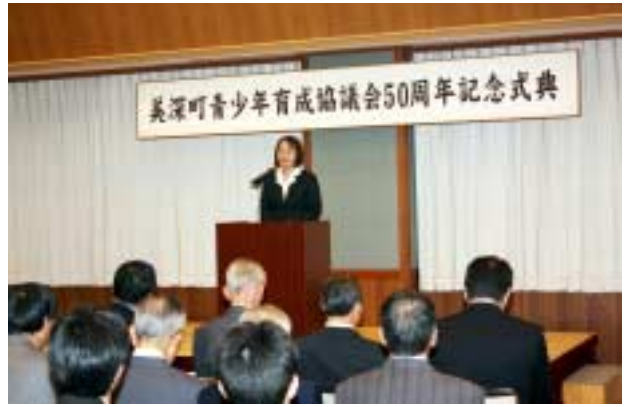
美深町青少年育成協議会50周年記念式典が文化会館で開催され、半世紀にわたる活動を振り返り、さらなる青少年育成に向け気持ちを新たにしていました。(3月18日)