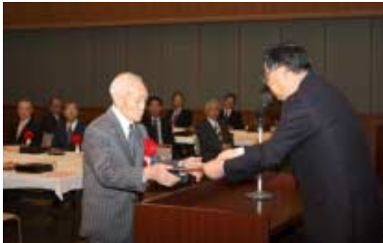
山口町長から受賞者に表彰盾と記念品が贈られました