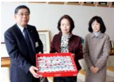
山口町長に「マスコット」が手渡されました