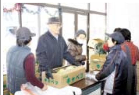
多くの町民が足を運んだ販売会の様子

この日、販売した雪中きゃべつは、前日に掘り起こした越冬用「冬王2号」3、000玉で、多くの町民が足を運び、店にはぎわいを見せていました。