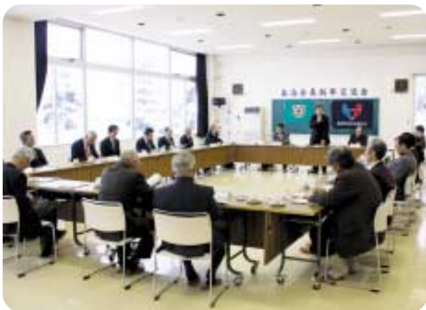
自治会連合会による自治会長新年交流会がびふか温泉で開かれ、山口町長などと意見交換を行いました。（1月14日）