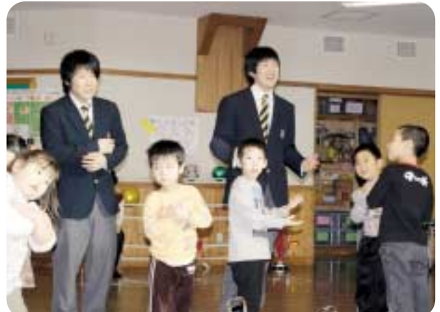
美深高校3年生による音楽発表会が、幼児センターで開催され、生徒と子どもたちは音楽を通じて交流を深めていました。（12月20日）