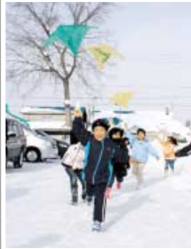
元気に「たこ揚げ」をする子どもたち

終了すると、さっそく外に出て、たこ揚げを行ない、子どもたちは高く舞い上がるたこに、目を輝かせながら元気に楽しんでいました。