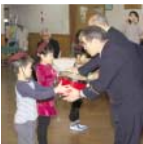
鼓笛隊セットを受け取る園児代表

で演奏を披露。清水目幼児センター長は、「今後も防火、防災に対する意識を高め、指導内容を充実していきたい」と述べていました。