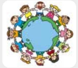
(2月22日) 世界友情の日