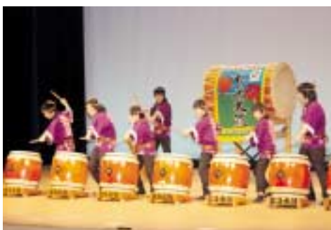
美深北斗太鼓芸能保存会少年部のステージ