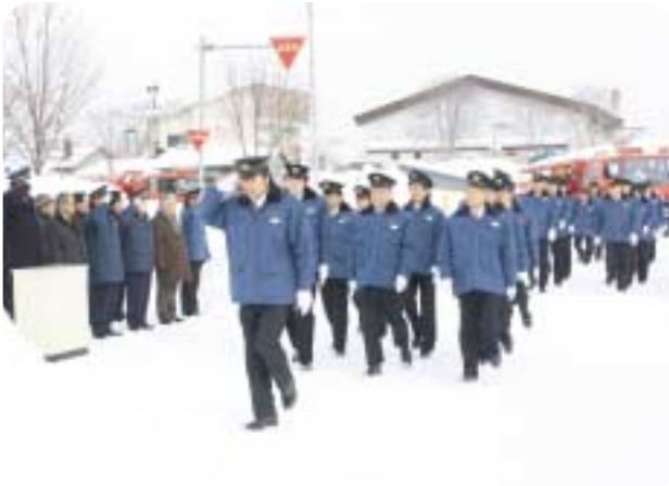
美深消防団の平成24年出初式が文化会館COM100で開催され、団員は1年の活動に向け、気持ちを引き締めていました。（1月5日）