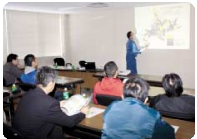
町と道主催の狩猟免許出前講座が、役場で開催。20人が参加し、野生鳥獣の状況や狩猟免許取得までの流れについて認識を深めていました。（12月21日）