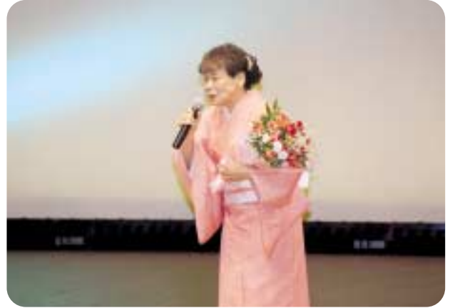
美深町文化協会主催の第4回上川北部カラオケ選手権大会が文化会館COM100で開催され、各市町村のカラオケ愛好者が出演して歌唱力を競い合いました。(2月12日)