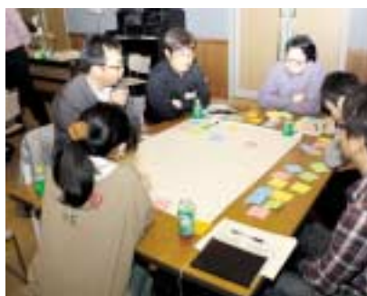
議論を交わす参加者たち