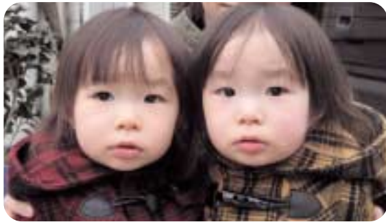
〇元気で、笑顔いっぱいな子に育ってね … (父・母)

ごみの不法投棄や野外焼却はやめましょう ごみ(廃棄物)は法律などの定める方法により、適切に処理しましょう。 また、自分の土地だからといって、むやみにごみを捨てたり野外で焼却すると、次のような罰則を受けます。 ●ごみを投棄したり野外焼却すると 5年以下の懲役または1、