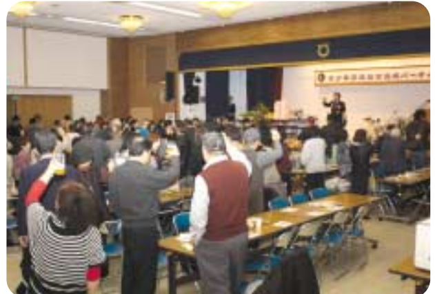
美深ライオンズクラブ主催の第45回青少年育成基金造成パーティーがSUN21で開催され、参加者は、お楽しみ抽選会などで楽しいひとときを過ごしていました。(2月15日)