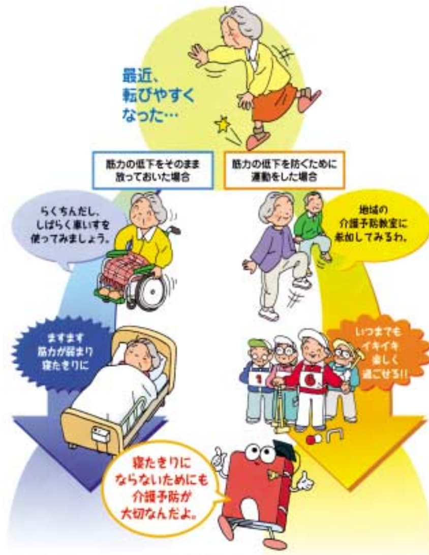
【図-1】 例えばこんな老化のサイン

おけば身体は弱るばかりで、生活する上で支障が出たり、趣味を楽しむ意欲がなくなったり生活の質を低下させます。元気に生活を続けていくためには、生活習慣病予防に加え、「廃用症候群」、「老年症候群」などの日常生活におけるサインを早期発見し、対応していくことが大切です。【図-1】