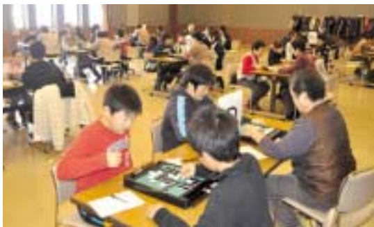
オセロを楽しむ参加者

午後の食事会では、ボランティア団体いぶきの会が作ったカレーライスが振る舞われ、美味しく味わったほか、「子ども映画祭」とし「カーズ2」が上映され、参加者は家族や友人たちと