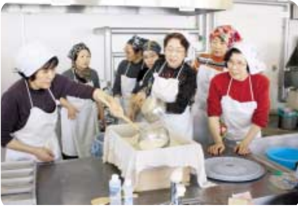
美深町農業振興センター主催の豆腐作り教室が開催され、参加者は豆腐、鶏肉おからハンバーグなどの調理方法を学んでいました。(2月24日)