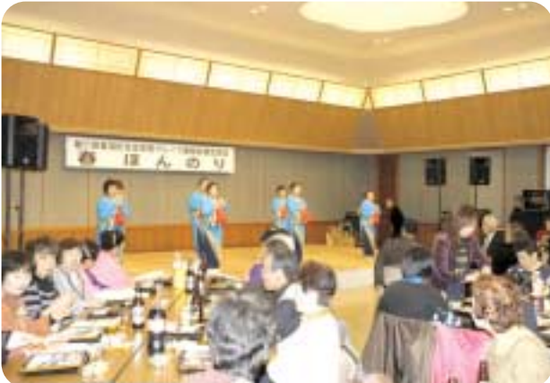
美深町生涯学習グループ連絡会議主催の「春ほんのり」が文化会館COM100で開催され、同会議に加盟する団体が、歌や踊りなど日頃の練習成果を披露していました。(3月4日)