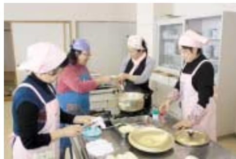
楽しみながら調理をする参加者