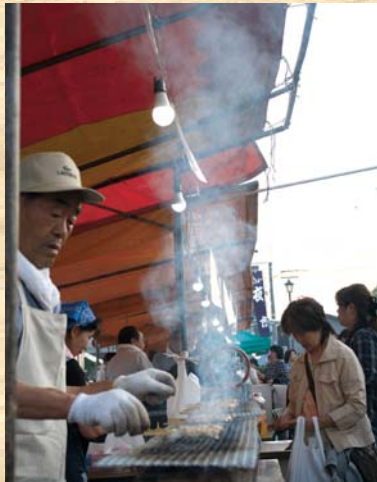
出店の様子「やきとり」