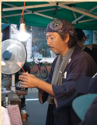
なつかし屋サクラ堂「鉛細工」

各商店街では、趣向を凝ら した多彩なイベントが開催さ れ、たくさんの町民でにぎわ いました。