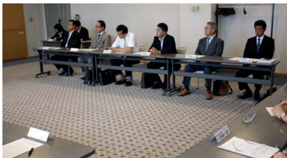
青少年の事件事故防止に向けて意見交換

教育関係機関からは、夏休みの生活について意見交換を行い、青少年の安全を守る体制強化を図りました。