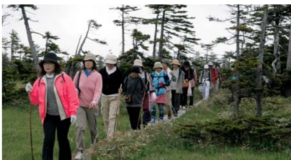
自然を堪能している参加者

また、下山後は環境省の名水百選に認定された仁宇布の冷水や雨霧の滝、女神の滝を見学し、参加者たちは楽しく会話を弾ませました。