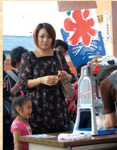
子どもに人気「かき氷」