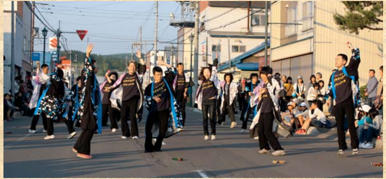
のぞみ学園生 美深あっぱれ隊「よさこいソーラン」