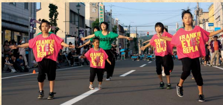
オーディーエスムーバーズ「ヒップホップダンス」