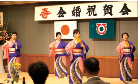
余興の踊り「女泣川(おなきがわ)」