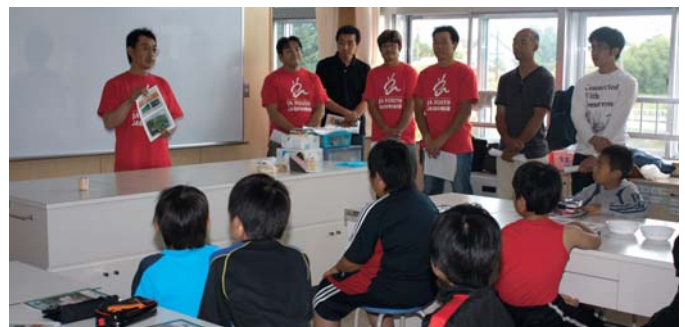
児童に地域の農業を説明をする青年部員