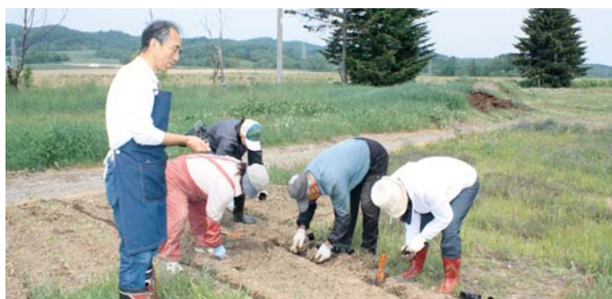
ハーブの苗植えに汗を流す参加者