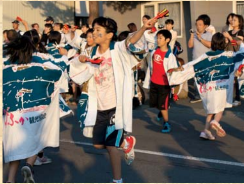
美深小学校児童 北の魂「よさこいソーラン」