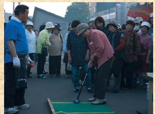
「旭町パークゴルフ大会」