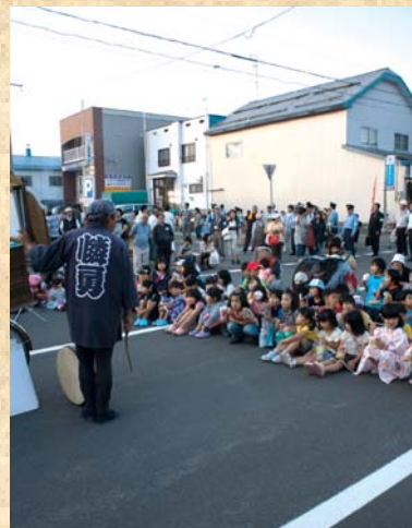
なつかし屋サクラ堂「紙芝居」