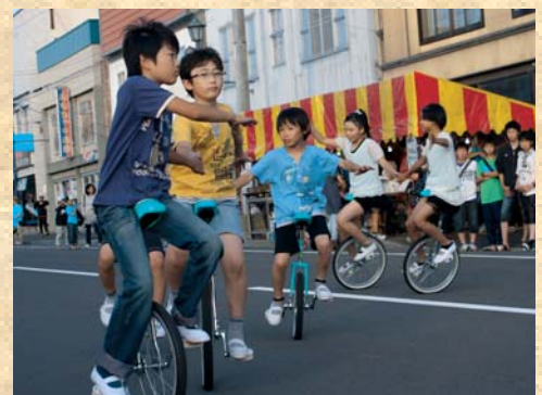
美深一輪車クラブ「一輪車演技」