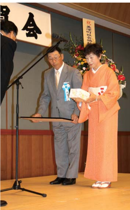
金婚証記並びに記念品贈呈の様子

祝賀会では会食が行われ、招待を受けたご夫婦らは、踊りの余興を楽しみ、苦楽を共に過ごしてきた50年の歳月を思い起こしながら、和やかに歓談されていました。