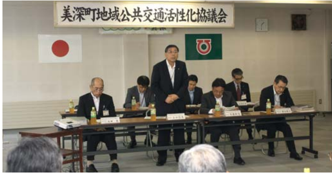
フレンドバス運行事業を説明

また、フレックスバスの「フレ」、デマンド式とフレンドの「んど」をかけ、町民に楽しく利用してもらおうと、市街地フレックスバスの愛称を「フレンドバス」としたことも報告しました。フレンドバス運行時間は、利用者の要望に応じて午前9時と午後9時（夜間運行）