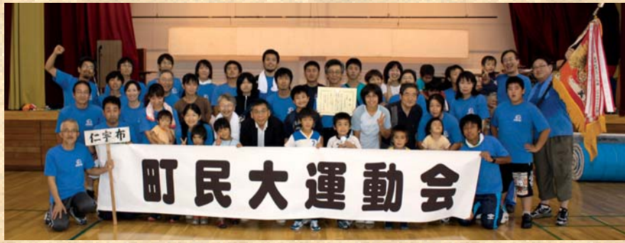
見事優勝を果たした仁宇布自治会のみなさん！