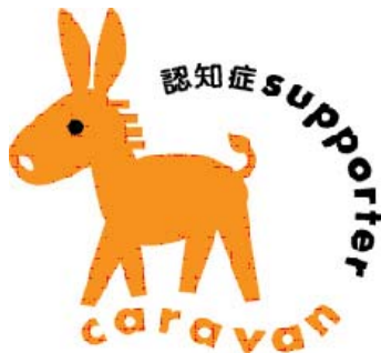
▲イメージキャラクター

キャンペーンの一環である「認知症サポーター100万人キャラバン」では、認知症を正しく理解し、認知症の方や家族を見守る、「認知症サポーター」を養成し、サポーターの輪を広め、安心して暮らせる町づくりを目的として活動が展開されています。