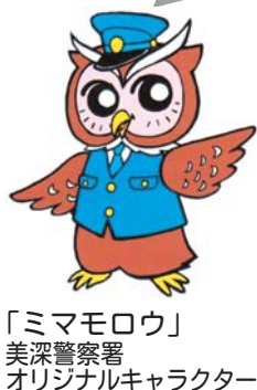
「ミマモロウ」 美深警察署 オリジナルキャラクター

美深警察署 TEL・防災情報端末機2・1110 少年相談110番 0120・677・110 警察相談電話 0166・34・9110 または #9110