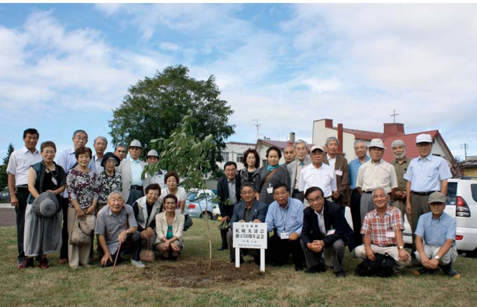
植樹したハルニレの幼木を前に記念撮影（後方は町民体育館前のハルニレ）

商工会・郷土研究会など町内各団体で組織され、美深町出身者との親睦と札幌美深会や東京美深会の相互交流などの支援を行います。