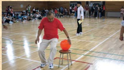
風船を割る「血圧測定」

雨天により、平成14年以来となる町民体育館での開催でしたが、今年も17自治会が総力を挙げて熱戦が繰り広げられました。子どもからお年寄りまでたくさんの町民が参加し、地域のきずなを深めました。 (8月26日)