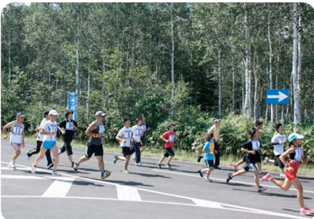
富士重工美深会主催の「SUBARU感謝祭in仁宇布」が富士重工業スバル北海道美深試験場（仁宇布）で開催。ウォークラリーやマラソン大会など、普段見る機会のないテストコースを楽しみました。 (9月5日)