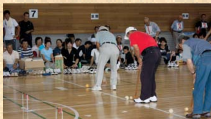
「ゲートボール競争」