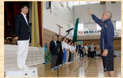
「選手宣誓」昨年度優勝 南自治会