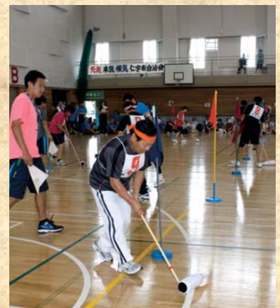
新競技「一升ごろごろ」