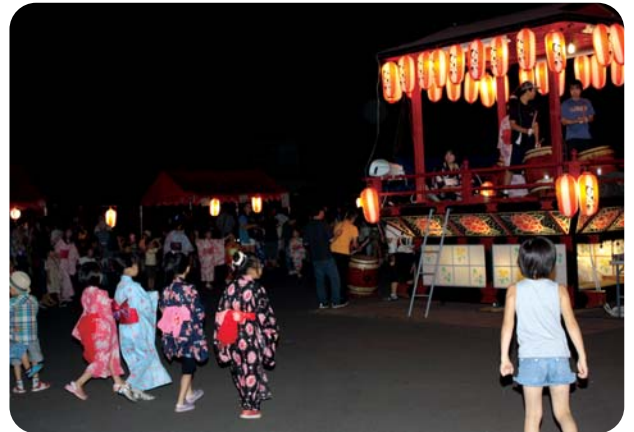
美深町観光協会主催の「美深ふるさと子供盆踊り」がイベント広場で開催され、色鮮やかな浴衣姿の子どもたちが、かわいらしい踊りを披露していました。 (8月14日)