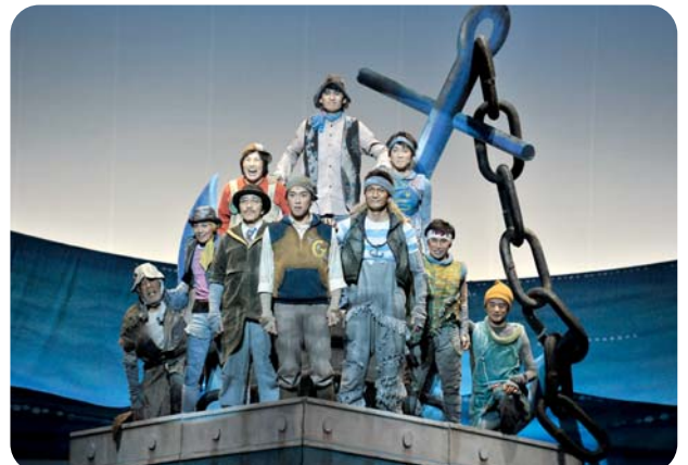
劇団四季ミュージカル「ガンバの大冒険」が文化会館COM100で開催。会場は多くの来場者で満席となり、次々と繰り上げられる出演者の巧みな演技に、魅了されていました。 (8月17日)