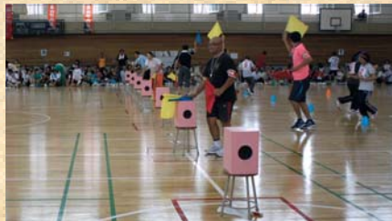
「運命のミラクルボックス」