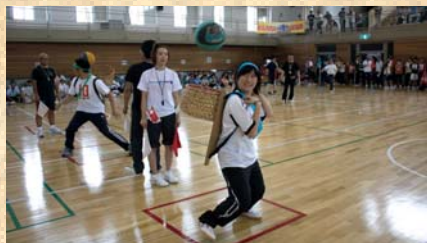
「天井からの贈り物」