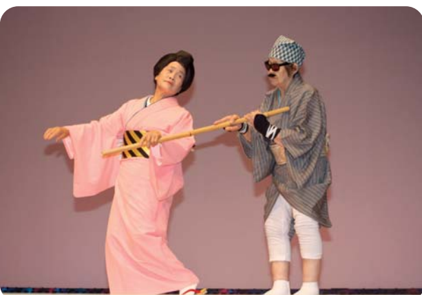
COMカレッジ110美深大学の大学祭が文化会館COM100で行われ、カラオケや踊りなど日頃の練習の成果を発揮していました。 (9月11日)